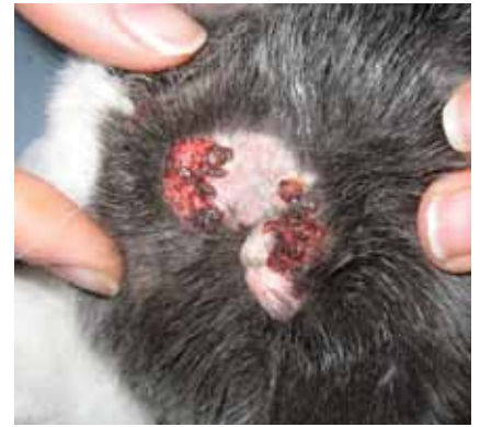
Kruste an Hals und Nacken bei der Katze, hervorgerufen durch Selbsttrauma