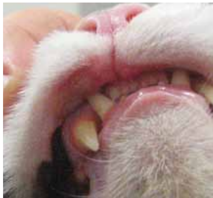
Indolenter Lippenulkus der Katze