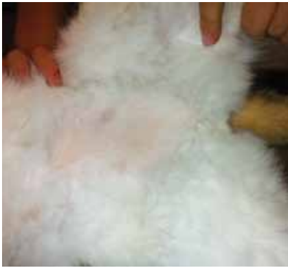
Bilaterale symmetrische Alopezie, verursacht durch Herbstgrasmilben