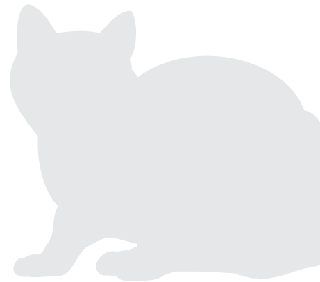
alle Bilder | Copyright: Dr. U. Mayer

Ein Selbsttrauma von Kopf und Nacken ist meist leicht zu erkennen, es äußert sich in Läsionen mit Erosionen, Exkoriationen und Krusten. Die Alopezie am Bauch ist hingegen nicht so einfach zu erkennen. Die anderen Formen können auch ganz ohne Juckreiz auftreten. Die miliare Dermatitis ist visuell schwer zu erkennen und kann viel leichter ertastet werden. Dabei handelt es sich um kleine Krusten, die meist am Rücken, aber auch generalisiert, vorkommen. Zu den häufigen Präsentationen des eosinophilen